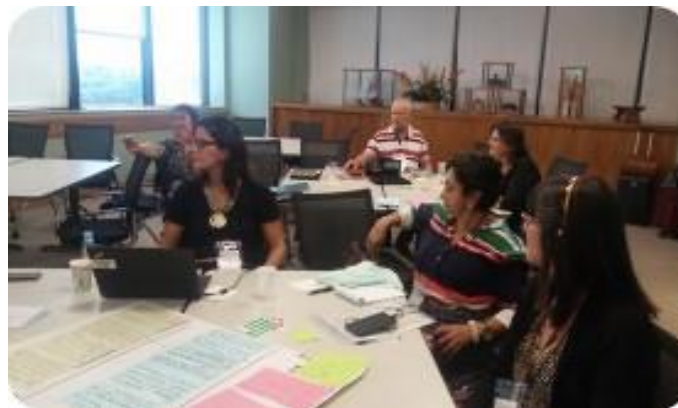
GT Grupos Vulneráveis e Direitos Humanos – Foco em Crianças, Adolescentes e Mulheres 04 de Novembro/ 2015 – Banco Mundial, Brasília