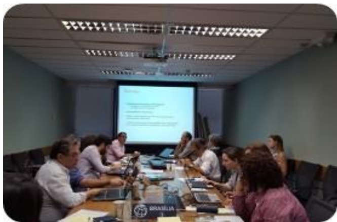
GT Agenda de Desenvolvimento Territorial 04 de Novembro/ 2015 – Banco Mundial, Brasília