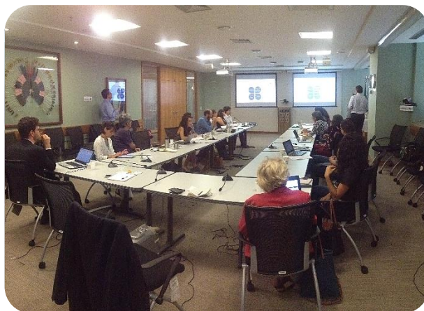
Reunião de Trabalho // Apresentação dos avanços por tema 13 de Novembro/ 2015 – Banco Mundial, Brasília