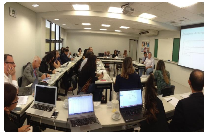
Plenária // Apresentação da Iniciativa e status dos trabalhos 25 de Novembro/ 2015 – FGV, São Paulo